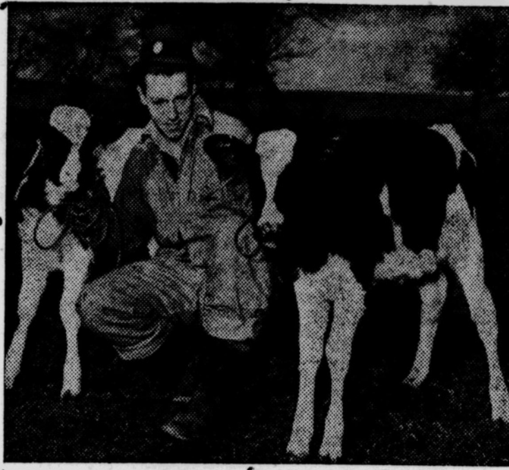
Seorang anak peladang dengan anak2 lembu yang dipiaranja sendiri. Di Amerika Serikat anak peladang berguru menternakkan ayam dan sapi dan bertjotok tanam dengan ilmu dan alat2 mutakhir.

„U.P.“ Shanghai, kabarkan Chiang Kai-shek meramalkan pe merintahnja tidak bisa didjatuhkan oleh antjaman komunis dan berkeras bahwa hari depan Tiongkok kelihatan tjemerlang. Sewaktu berpedapa dihadapan guru2 dan industrialis2 Shanghai, Gimo Chiang nampaknja optimistis meskipun antjaman komunis ke Peking dan Nanking semakin hebat.