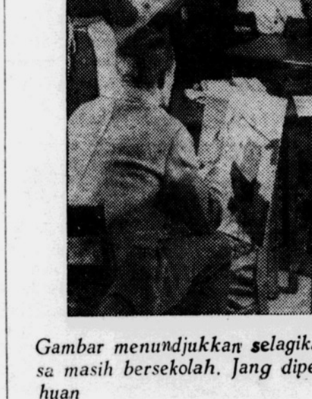
Gambar menunjukkan selagika di Amerika Serikat orang2 dewasa masih bersekolah. Jang dipeladjadi berbagai ilmu dan pengetahuan

semua ini dilakukan agar njata tidak mungkin berkerjasama dengan Soviet, menjatakan betapa perlu nja peperangan baru dan dengan de-